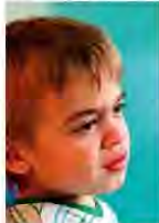
Typische Gesichtszüge eines Jungen mit Morbus Hunter

Häufige Mittelohr- und Atemwegsinfektionen sind kein Grund zur Sorge. Wenn Ihr Kind Leisten- oder Nabelbruch hatte, könnten aber auch andere Ursachen im Spiel sein. Ein Kind mit Morbus Hunter (Mukopolysaccharidose Typ II) zeigt typische Symptome wie einen vorgewölbten Bauch, steile Augenbrauen und breite Lippen. Häufige Verhaltensauffälligkeiten sind ein eingesunkenes Nasenrücken und eine eingesunkene Nasenwurzel. Dies kann den Stoffwechsel beeinträchtigen und zu Störungen der Funktion von Gelenken und Organen führen. Mehr Informationen unter www.huntersyndrom.de bei der Selbsthilfegruppe ( www.mp.de ).